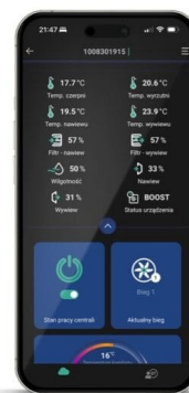
Lihtne juhtpaneel ja mobiiliäpp telefonis